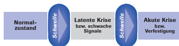
Abbildung 1: Phasenmodell

Um solche schwachen Signale wahrnehmen zu können, wird es im Kontext eines Frühwarnsystems auch darum gehen, Abweichungen bzw. Gefahrenpotenziale zu bewerten und zu filtern. Hier sind Schwellen zu benennen, deren Überschreiten das Eintreten eines kritischen Zustandes erwarten lässt. Auch bezüglich dieser Schwellenwerte können wir uns nicht auf „objektive“ Aussagen verlassen. Während man mit einiger Sicherheit vorherzusagen vermag, wie viel Druck ein Kessel aushalten kann, bevor er platzt, sind solche Grenz- bzw. Schwellenwerte im Sozialen Bereich wesentlich schwieriger zu bestimmen. Wann führt unzureichende Förderung und Fürsorge eines Kindes zu nachhaltigen Entwicklungsstörungen? Wie viel Konflikt vermag eine soziale Gruppe (z.B. Familie, Nachbarschaft) oder ein Sozialraum auszuhalten, bevor dies für die Beteiligten zu destruktiven und nicht mehr zu bewältigenden Beeinträchtigungen und Krisen führt? Abbildung 1 veranschaulicht die Funktionsweise eines sozialen Frühwarnsystems im Vergleich mit einer Ampel. Grün symbolisiert den Normalzustand, Gelb die Übergangsphase und Rot den Alarmzustand. Damit die Schwellen von grün zu gelb (latente Krise) sowie von gelb zu rot (akute Krise) konkretisiert werden können, bedarf es einer indikatorengestützten Beschreibung derjenigen Signale, die solche Übergänge ankündigen bzw. einleiten.